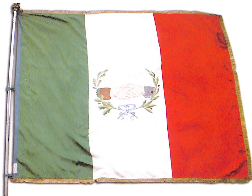
Vessillo sociale. Il classico simbolo delle Società Operaie di Mutuo Soccorso rappresenta due mani che si stringono per offrirsi vicendevole aiuto.

Furono questi organismi, le Società di Mutuo Soccorso, che cominciarono a costituirsi nella prima metà dell'Ottocento, essendo esse stesse la prima forma di associazionismo operaio in Italia.