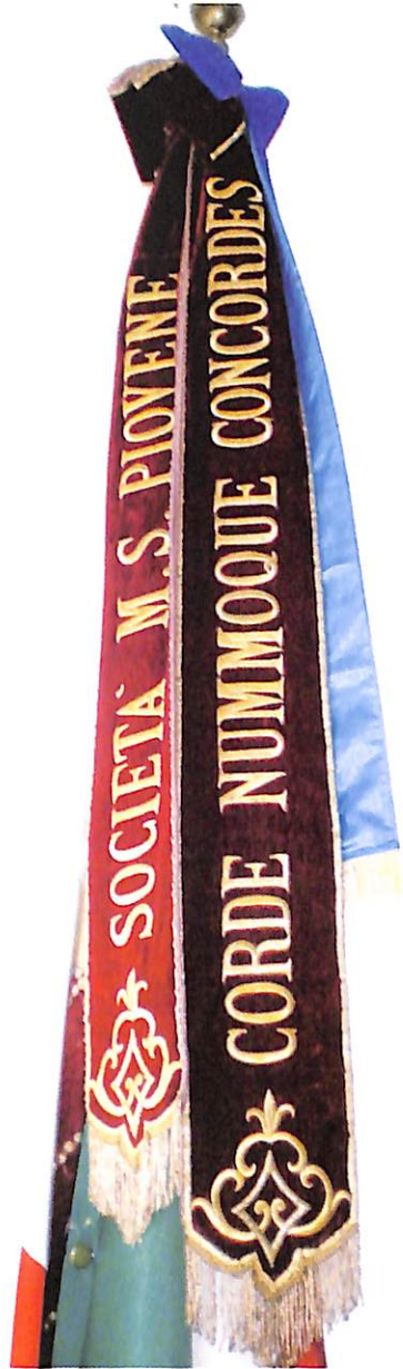
Vessillo sociale. Particolare. Il motto latino nell'elegante nastro di destra sottolinea il forte intento di concordia morale e materiale ( corde nummoque ) che anima la Società di Mutuo Soccorso.